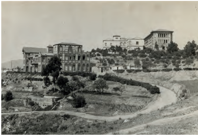
L'Hospital de l'Esperit Sant als anys quaranta.