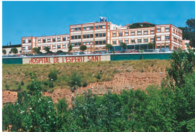
L'Hospital als anys noranta.