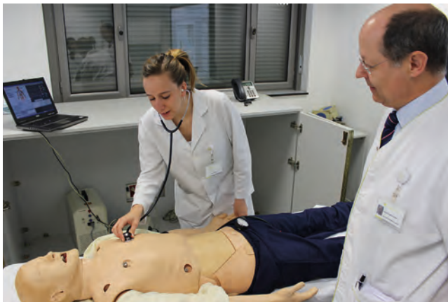
Formació de professionals sanitaris.