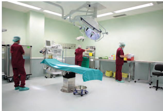
Quiròfan del nou edifici de l'Hospital.