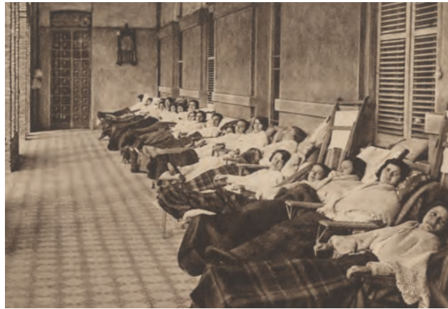
Galeria de repòs del Pavelló de Dones (anys trenta).